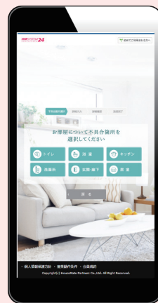
WEB 設備トラブル受付